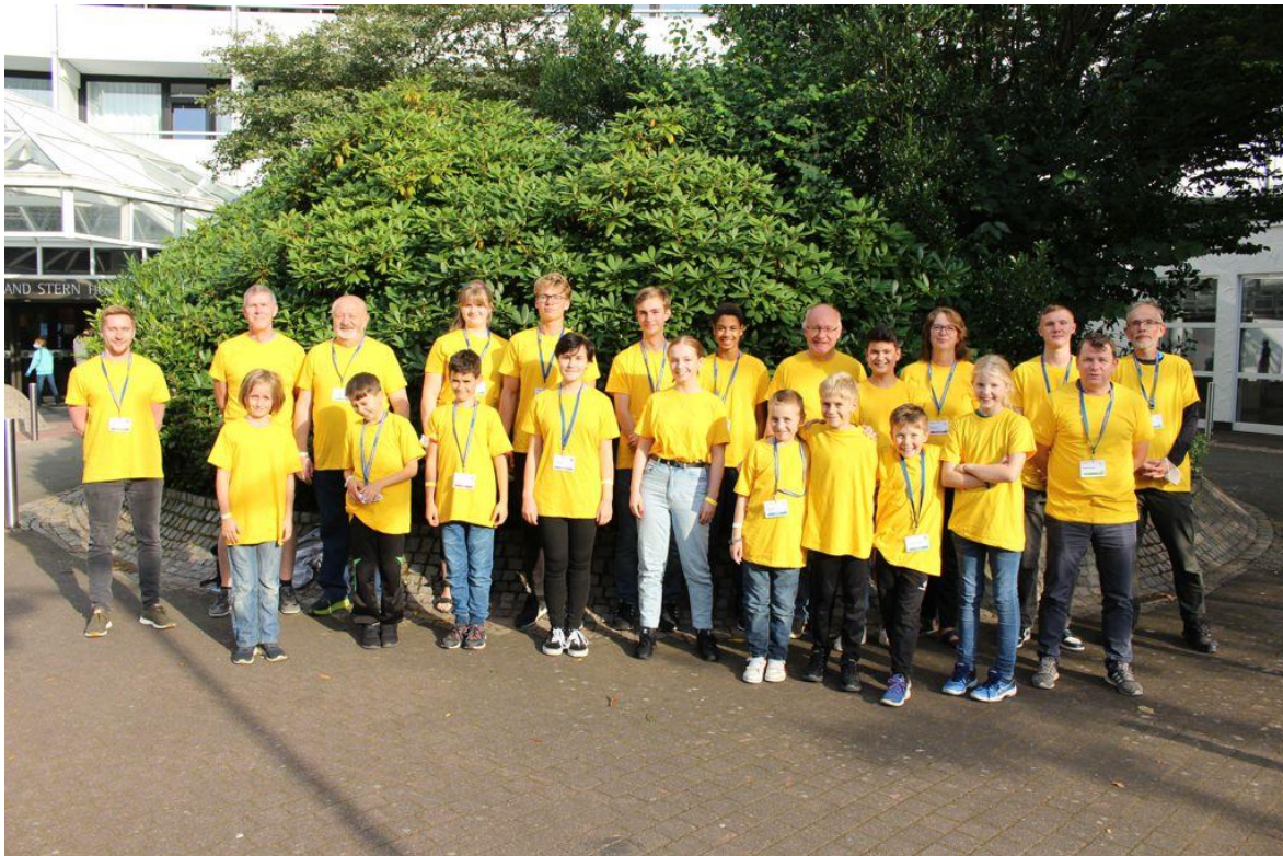
Die Brandenburger Delegation

Unser erstes Team gewinnt am grünen Tisch, weil der SC Havelland den Spieltag abgesagt hat. Durch dieses 8 zu 0 und die gleichzeitige Niederlage der Preußen aus Frankfurt gelingt doch tatsächlich noch der Sprung auf den dritten Tabellenrang. Damit hat man sehr lange gegen den Abstieg gespielt, um am Ende doch noch das Treppchen zu erreichen. Starke Leistung vom gesamten Team, auch wenn man diese Saison wohl kaum ansatzweise ernst nehmen kann.