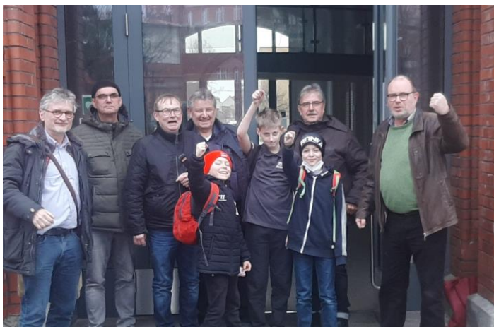
Siegerbild Hellas II

Nur ganz kurz... Beide Hellas-Mannschaften spielen stark und gewinnen ihre Spieltage. Hellas I besiegt Eberswalde deutlich mit 6 zu 2, unser zweites Team bringt aus Brandenburg nach einem 5,5 zu 2,5 Sieg ebenfalls zwei Mannschaftspunkte mit nach Hause. Morgen folgen einige Bilder und ein ausführlicherer Bericht. Habt einen schönen Abend!